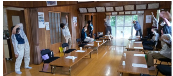
元気に体操！第3町内集会所