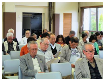
ふれあいねもと総会

次に平成28年度組織・役員案、事業計画案、予算案が審議され、承認されました。本年度は、創立10周年を迎えるので、記念講演会の開催についても討議され、承認されました。