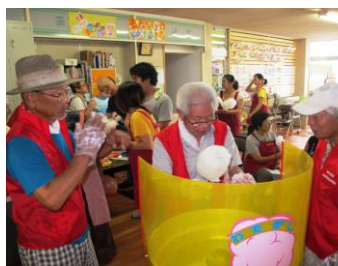
第2 おひさまクラブ

「第2 おひさまクラブ」は、NPO法人「多治見ひなたぼっこ」の関連施設で、根本駅前にあります。 綿菓子とポップコーンの機械を持ち込んで子ども達にたくさん食べてもらいました。